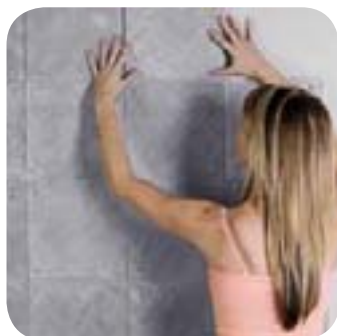
2. Je pose