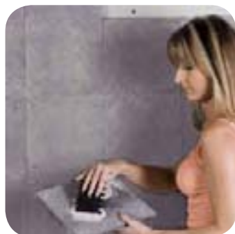
1. Je colle