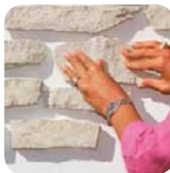
3. Je pose