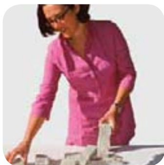
1. Je choisis mes pierres