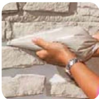
5. Je jointoie