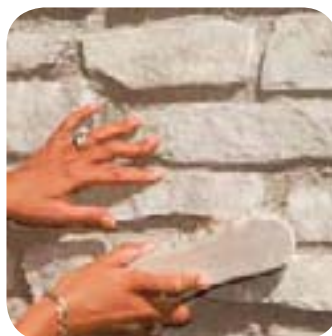
7. Je finis