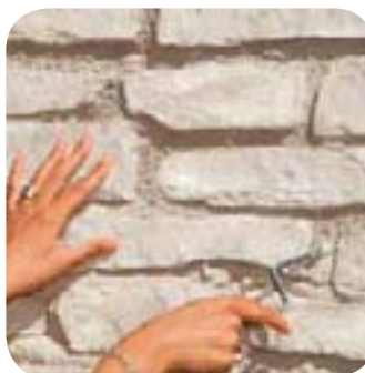
6. Je gratte