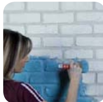
7. Je peins*