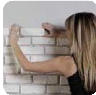
3. Je pose