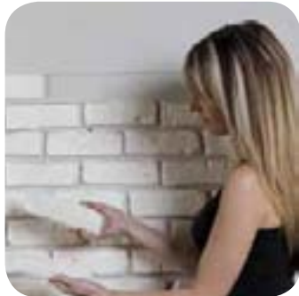
1. Je choisis