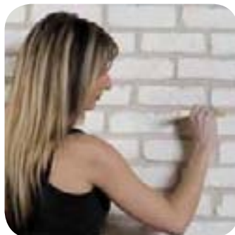
6. Je finis