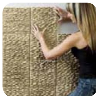
3. Je pose