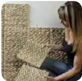
1. Je choisis