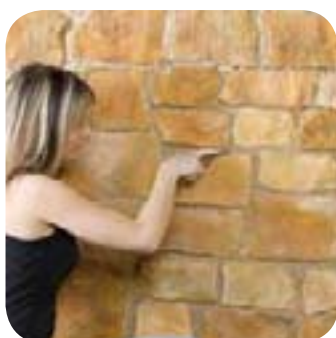
6. Je gratte