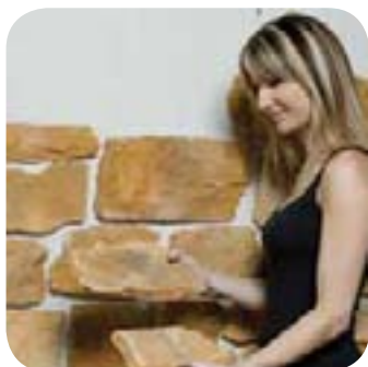
1. Je choisis