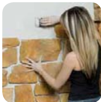
3. J'encolle le mur*