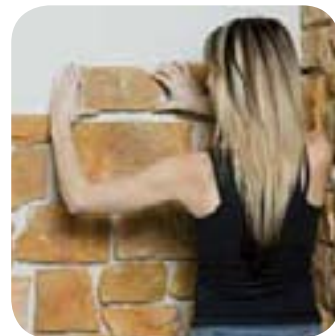
4. Je pose