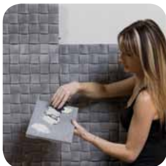
1. J'encolle la pierre*