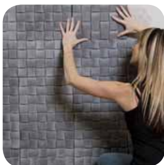
3. Je pose