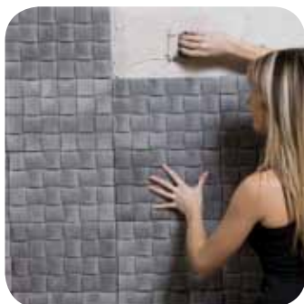
2. J'encolle le mur*